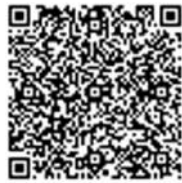
花の台子ども会 ホームページ