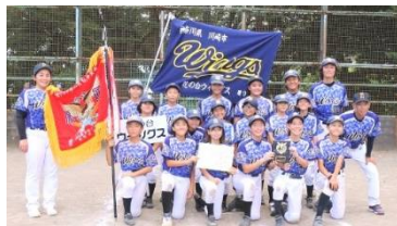
秋季神奈川県大会優勝