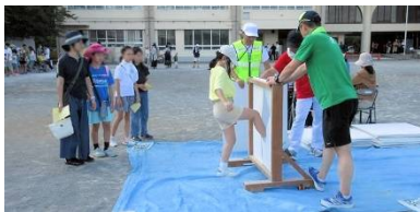
マンション仕切りの蹴破り