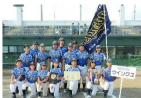
KENKO CUP 東日本大会優勝