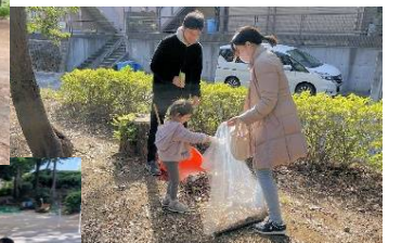
かわいいお手伝いも参加しました