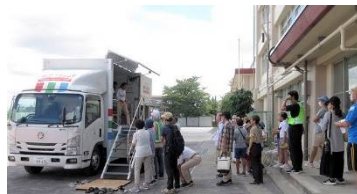
起震車で地震を体験