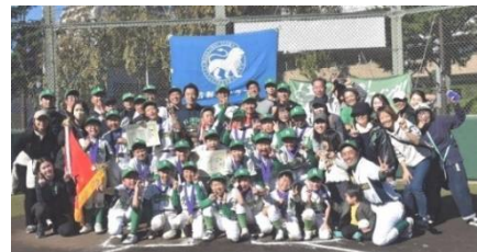
若獅子杯優勝(低学年)