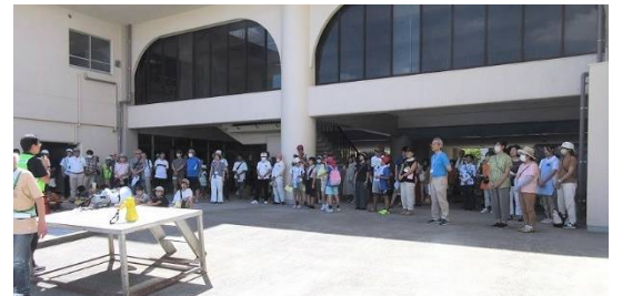
熱中症に配慮しての開会式

外の温度計が40度を示すほど暑い中での訓練となり、皆様からはアンケートや貴重なご意見を多数頂きました。今後の企画に役立てたいと思います。ご参加・ご協力頂いた皆様、大変ありがとうございました。