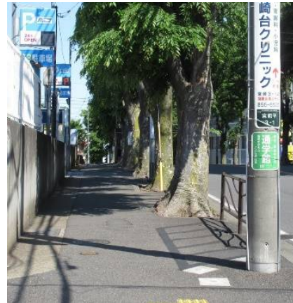
閉鎖した駐輪場跡(上) 歩道が広くなりました

従来の駐輪場は花園橋から北にのびる歩道(通学路)上に併設されていたので、近隣住民から安全面で不安視する声があり、新駐輪場の開設に伴い閉鎖され元の歩道に復原されました。子どもたちも安心して通れます。