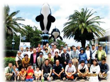
鴨川シーワールドにて

を訪ねました。緑の谷間を流れ落ちる滝は日差しの加減で「滝の辺にハートが見える」とロマンス好きの人に人気とか。帰りは落花生を土産に、再びアクアラインを通して花園橋に全員無事帰着。また今期も町会活動の健闘を誓い解散しました。