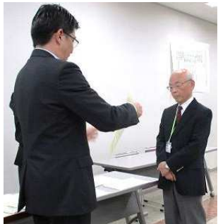
退任役員への感謝状贈呈