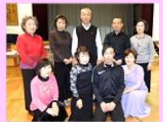
ダンスの子カラ(ダンスビューより)

80年代ポップやロック、マイケルジャクソンなどを聴くと自然と身体が動いて踊りたくなりますよ～。