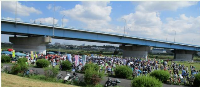
各区から多くの団体が参加し、開会式が開かれました。