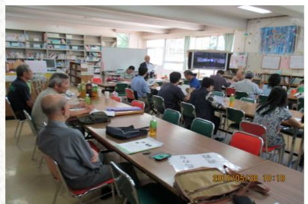
熱心に討議される参加者

花の台自主防災組織は今後も引き続きこの種の催しを企画します。皆様の是非のご参加をおすすめ致します。万一の時の減災のため、みなで知恵を出し合ひましょう。