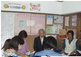
打ち合わせ中のメンバー

花の台町内会では7月23・24日開催予定の盆踊り大会に避難者を招待し、みんなで輪を作ることを決めています。また5月の町内会総会では席上、出席者から、町内会連合会を通じて被災地へ送る義援金を集めました。みなさんありがとうございました。盆踊り大会へのご参加もよろしくお願いたします。